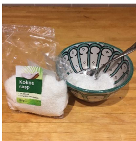
Doe een paar flinke lepels kokos in een schaaltje.