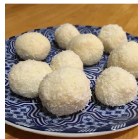
Ruim alles netjes op. Presenteer de balletjes op een leuke schaal. Eet smakelijk!