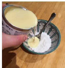
Giet een scheutje gecondenseerde melk bij de kokos.