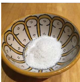
Doe in het andere schaaltje een lepel droge kokos.