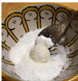
Rol de balletjes door de losse kokos.