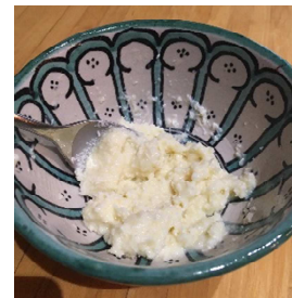
Roer tot een samenhangend mengsel.