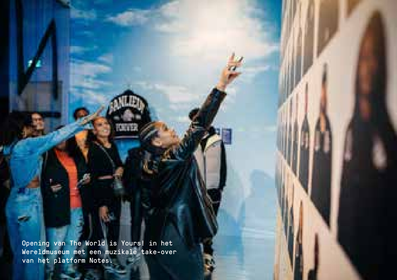
Opening van The World is Yours! in het Wereldmuseum met een muzikale take-over van het platform Notes.