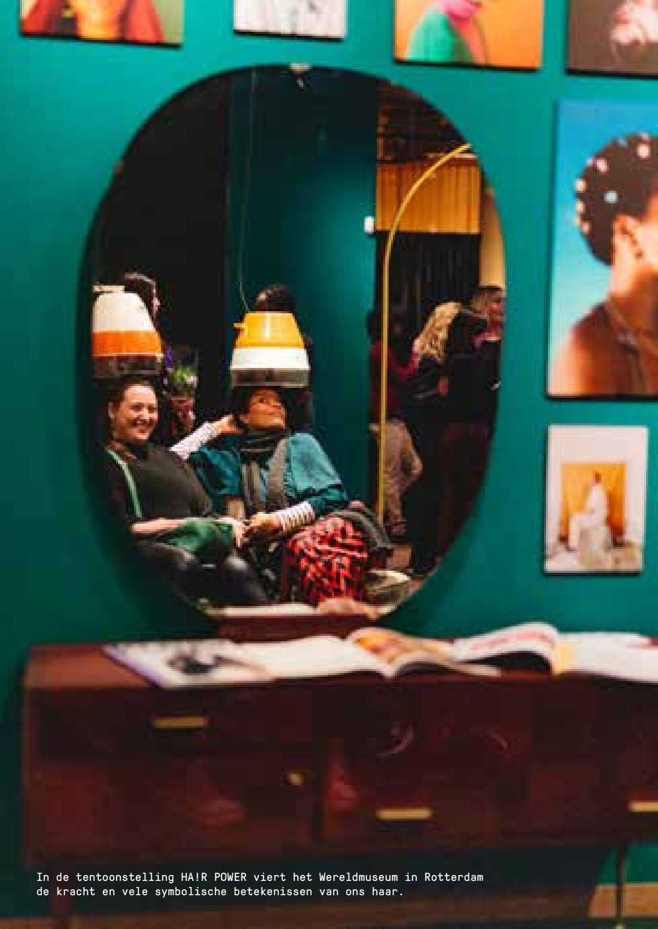
In de tentoonstelling HAIR POWER viert het Wereldmuseum in Rotterdam de kracht en vele symbolische betekenissen van ons haar.