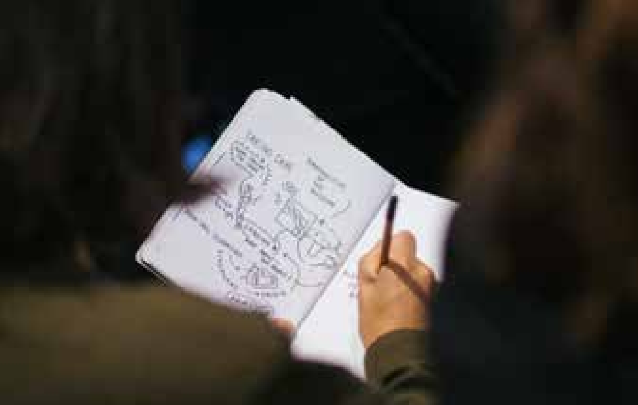
Aantekeningen tijdens de Taking Care conferentie op 2-4 november.