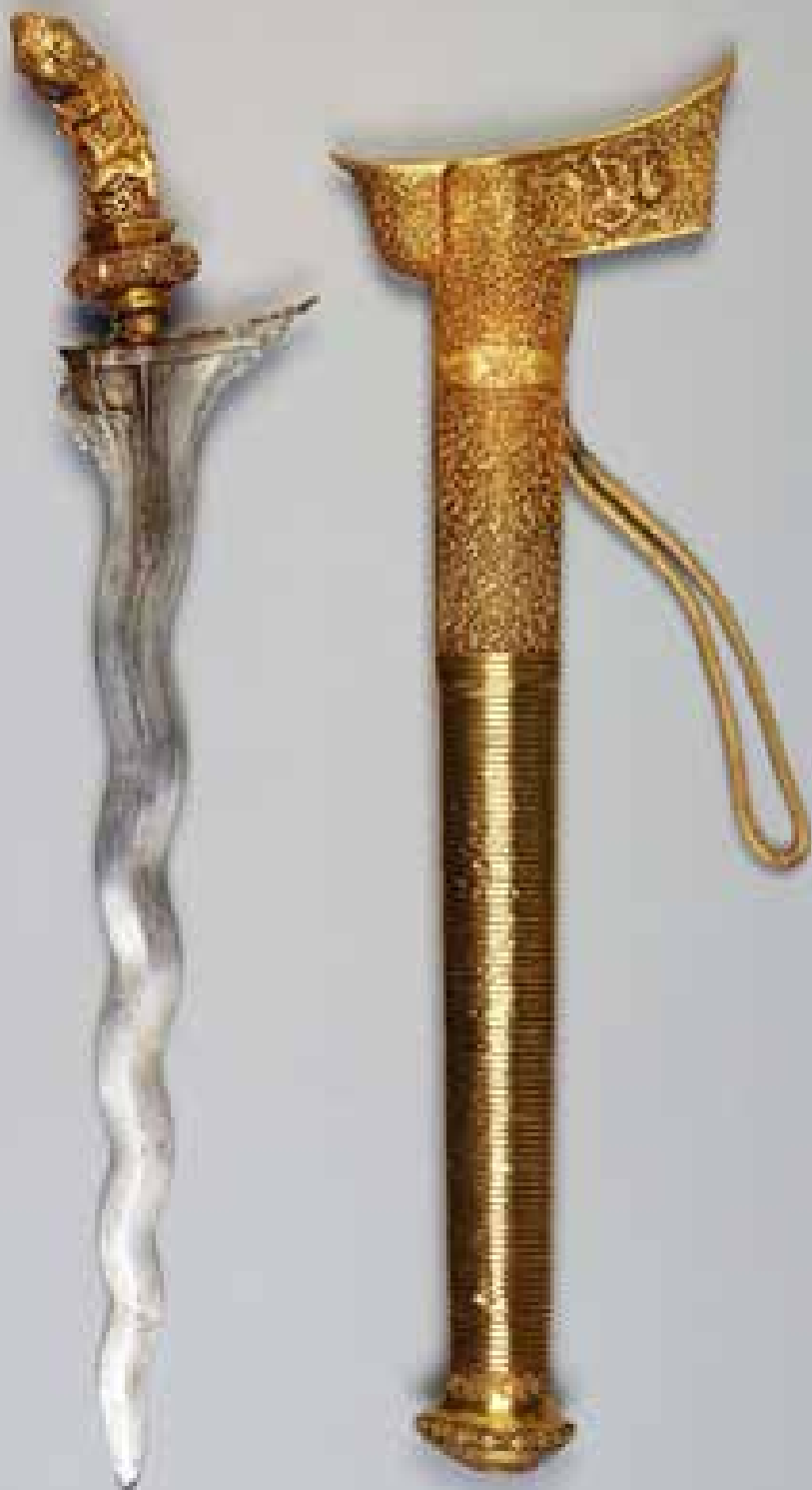
Ceremoniële kris uit Zuid-Sulawesi, inventarisnummers RV-360-6021a t/m d, PPROCE herkomstverslag nr. 8.