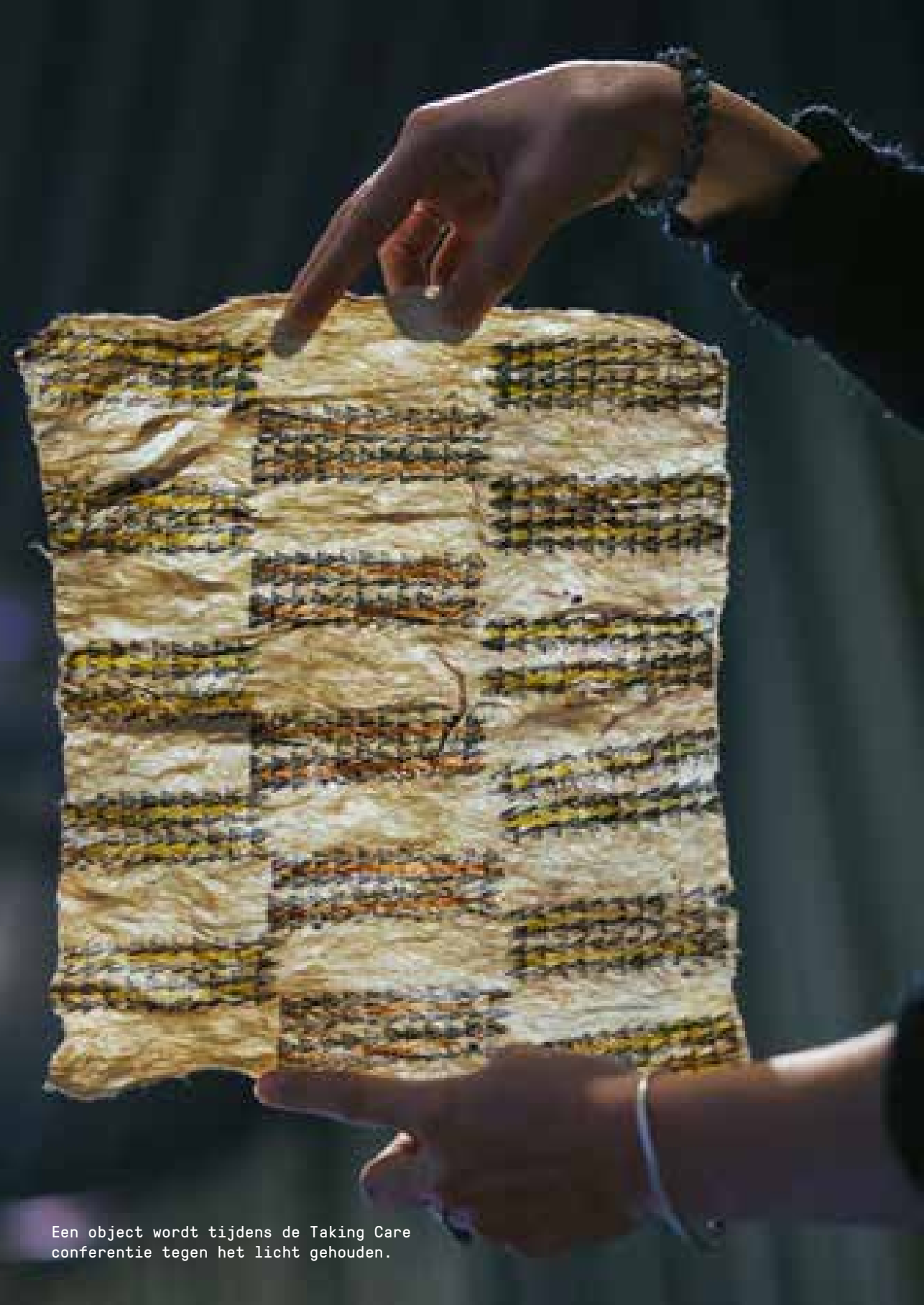
Een object wordt tijdens de Taking Care conferentie tegen het licht gehouden.