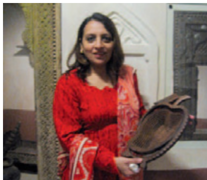
'Deze bak is heel mooi en is met de hand gemaakt in Pakistan.'