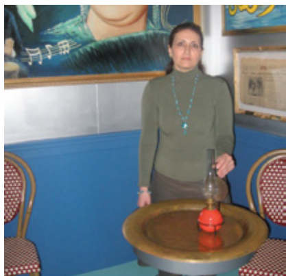
'Ik vind deze olielamp heel mooi. Het is echt Turks en het is al oud, antiek.'